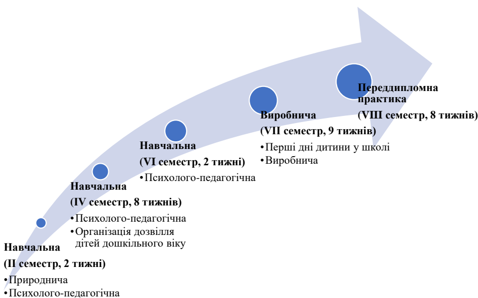
Рис. 1.2. Види педагогічних практик